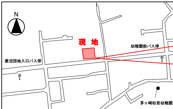
■案内図(茅ヶ崎市菱沼2丁目17番)