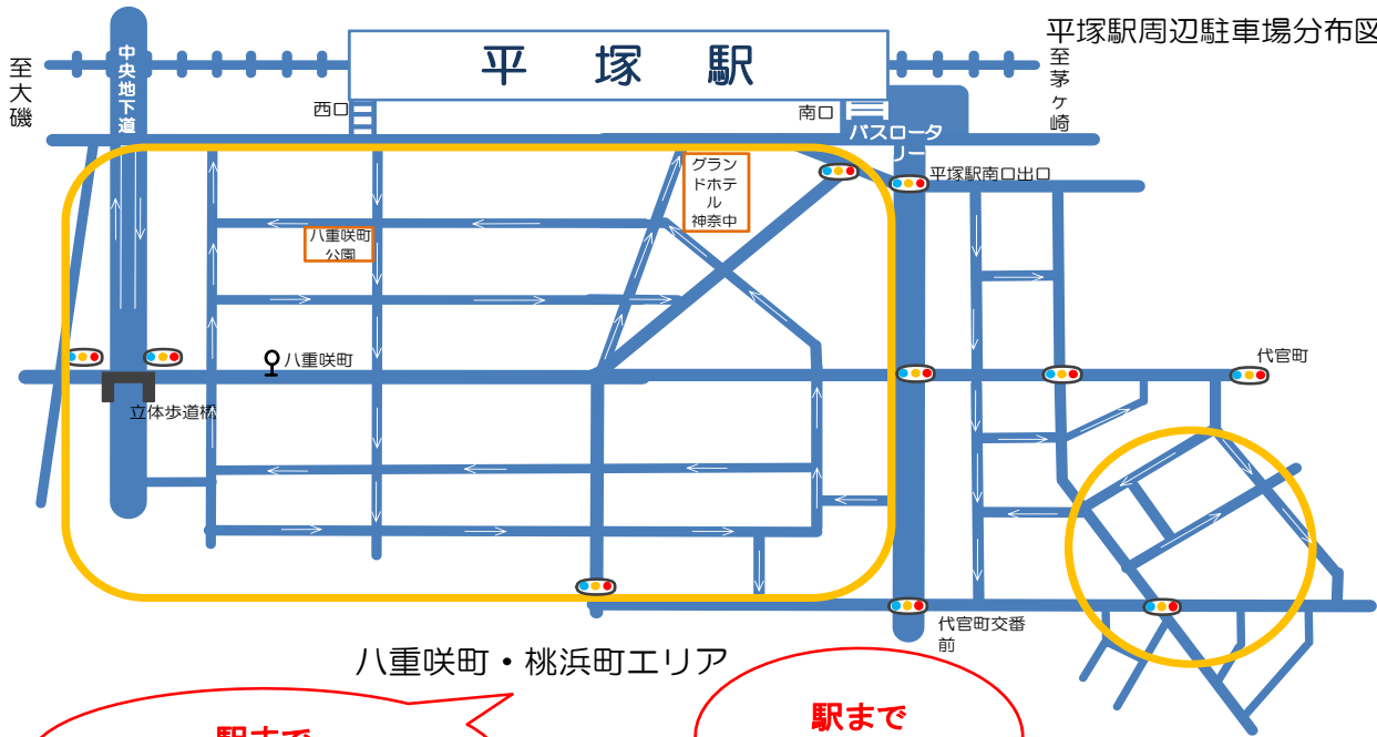
平塚駅周辺駐車場分布図