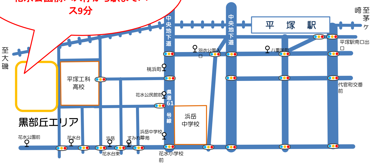
平塚駅周辺駐車場分布図