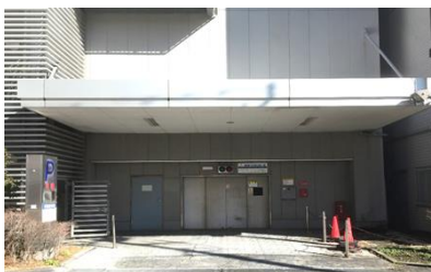
(機械式タワーパーキング)