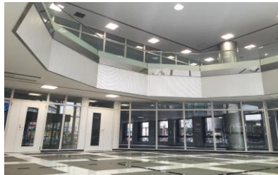
(エントランスホール)

■建築概要 名称 神奈中厚木第一ビル 住居表示 厚木市中町三丁目6番13号 敷地面積 959.53㎡ (290.25坪) 建築面積 712.75㎡ (215.60坪) 延床面積 5,316.58㎡ (1,608.26坪) 構造規模 鉄骨造陸屋根8階建 設計監理 東急・総合設計共同企業体 施工年月 大成・小田急建設共同企業体 2001年2月 ■設備概要 天井高 1~2階2,800mm、3~8階2,600mm 空調 EHPエアコン エレベーター 13人乗り乗用2基 駐車設備 機械式タワーパーキング36台