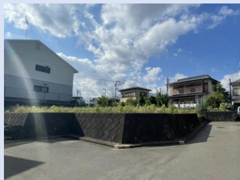
現地写真(造成前・2023年6月撮影)