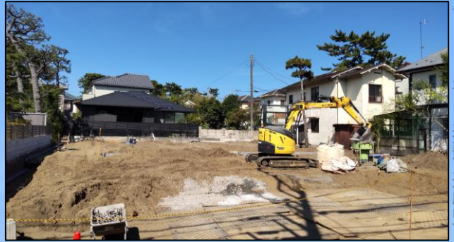
■現地写真 (2023年7月撮影、造成中)