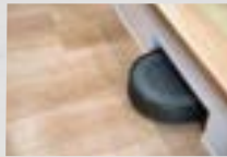
お掃除ロボット基地